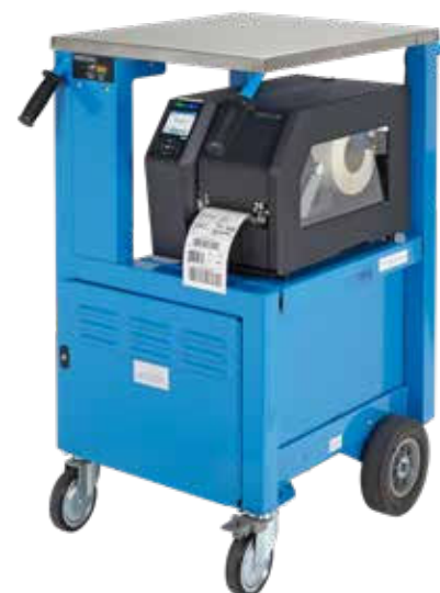
Mobile PrintCart alimenté