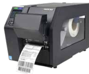
Vérificateur de codes à barres (T8000 ODV-2D)